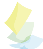
Hojas de reúso