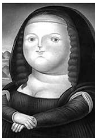
Mona Lisa, 1977 Fernando Botero

¿Qué concepto artístico corresponde a la segunda imagen?