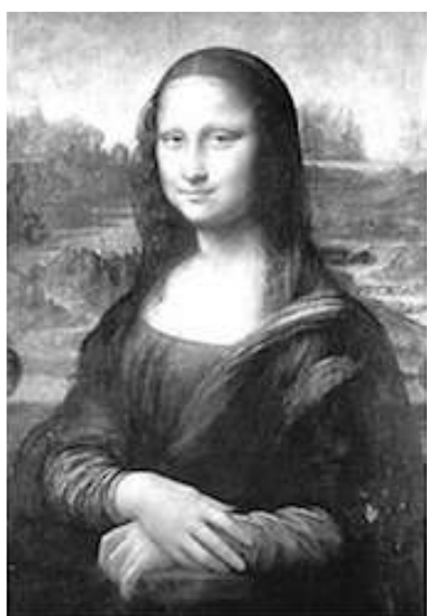
Mona Lisa, aprox. 1503–1506 Leonardo Da Vinci

Observa con atención las siguientes imágenes y responde la pregunta: